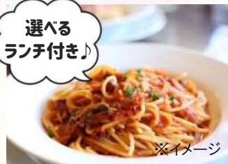
ランチ会場：欧風バルBON