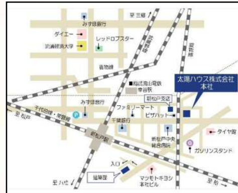
所在地：松戸市新松戸1-204 JR常磐線・武蔵野線「新松戸駅」徒歩7分