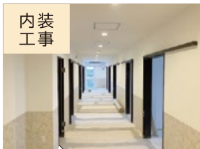
十日市場老人ホーム